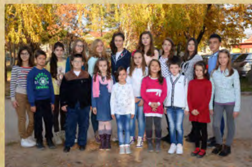
ОШ „Бранко Миљковић“