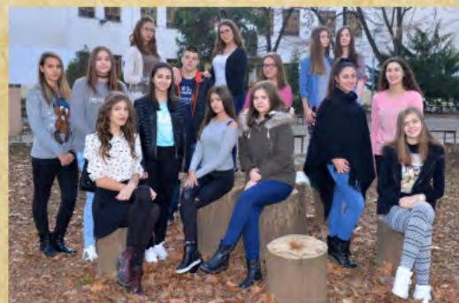
ОШ „Краљ Петар-Први“