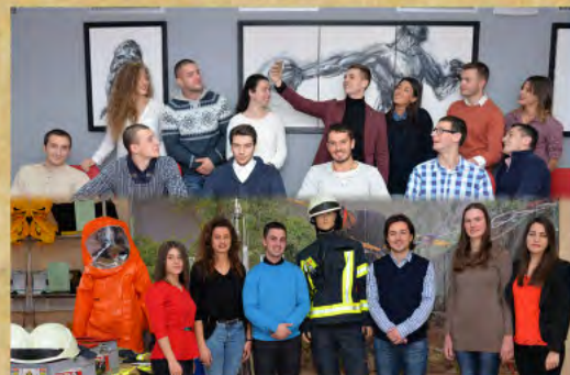
Факултет спорта и физичког васпитања - Факултет заштите на раду