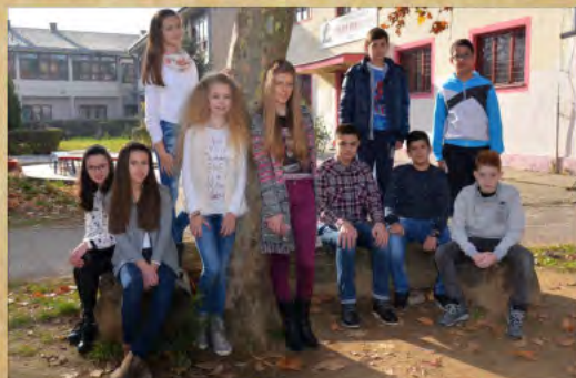
ОШ „Десанка Максимовић“ -Чокот