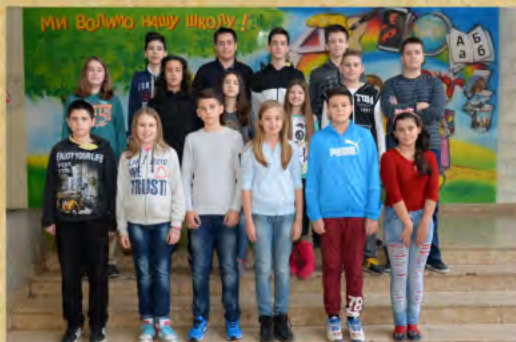
ОШ „Коле Рашић“