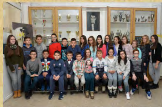
ОШ „Бранко Миљковић“