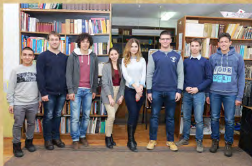
Гимназија „Светозар Марковић“