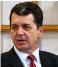
Александар Ждрале председник Општине