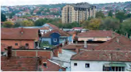
ГРАДСКА ОПШТИНА ПАЛИЛУЛА