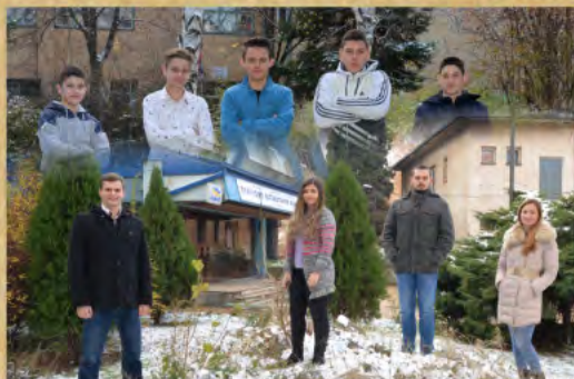
ОШ „Сретен Младеновић – Мика“ - Природно–математички факултет