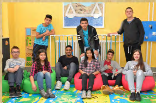
Школа са домом ученика „Бубањ“