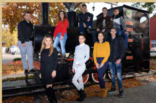
ЕТШ „Мија Станировић“ - МАШИНСКА ШКОЛА