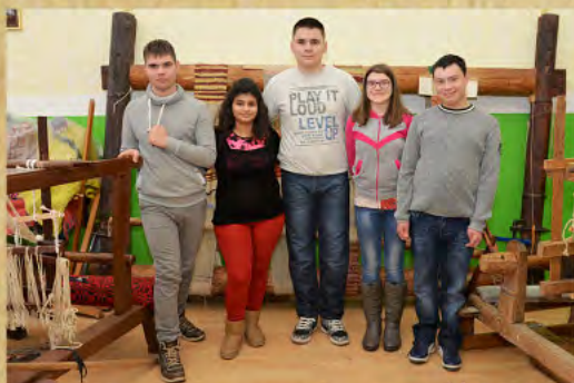
Школа за основно и средње образовање „14. Октобар“