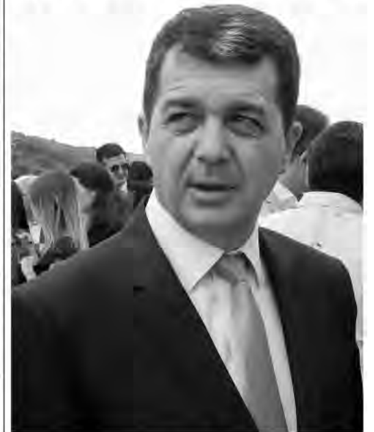
Председник Градске општине Палилула Александар Ждрале, поводом 5. јуна, Светског дана заштите животне средине