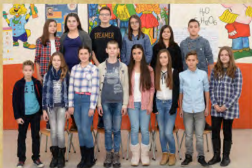
ОШ „Бранко Радичевић“ – Габровац